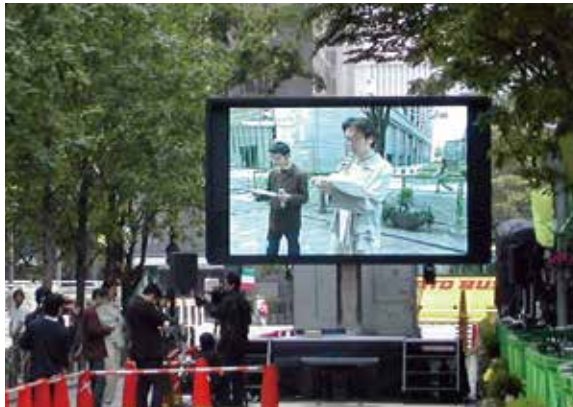
▲ 自転車スプリントGP in 丸の内

90度の回転機構に加え、 リフトアップ機構を装備。 多彩な設置環境に対応できる 8mmピッチLED映像システム