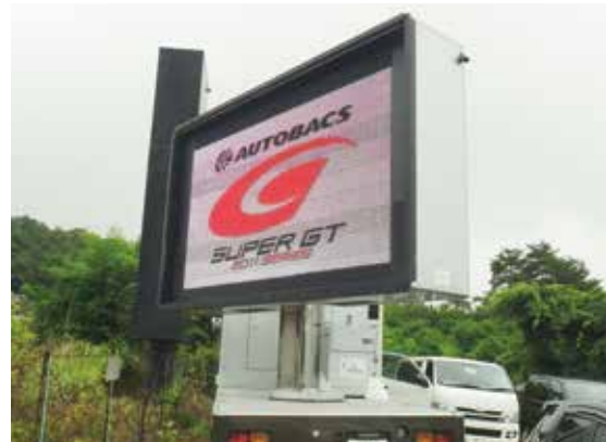
▲ SUPER GT

最新の8mmピッチBlackSMDをビルトインした高輝度、高画質を実現する「パノラマビジョンジュニア2号機」。190インチの画面に「90度回転機構」と「リフトアップ機構」を採用。パノラマビジョンジュニア1号機同様に、4t車をベースとして機動力を大幅に向上。プロモーション等のあまり条件の良いくない設置環境においても「2つの機能」が常に100%に近い能力を発揮。見る人に適格な情報と感動を与えることができる映像システムです。