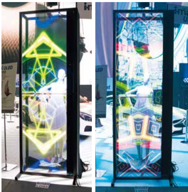
専用のディスプレイフレームにLO55を縦に2面設置した演出例

透過率45%を誇る有機ELディスプレイの特長を生かして、商品の演出や空間の演出に新しいカタチを提案