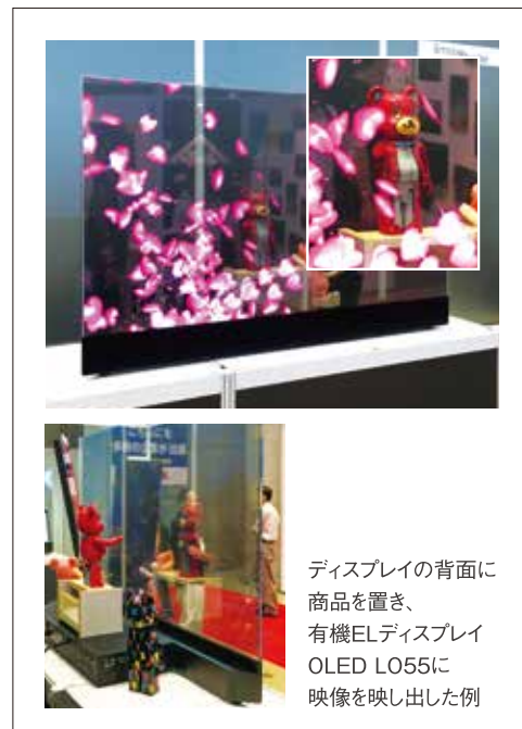
ディスプレイの背面に 商品を置き、 有機ELディスプレイ OLED LO55に 映像を映し出した例