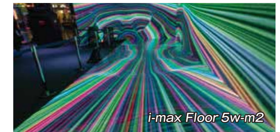
■ アイマックスフロア 5w-m2 LED / 1パネルあたりの仕様