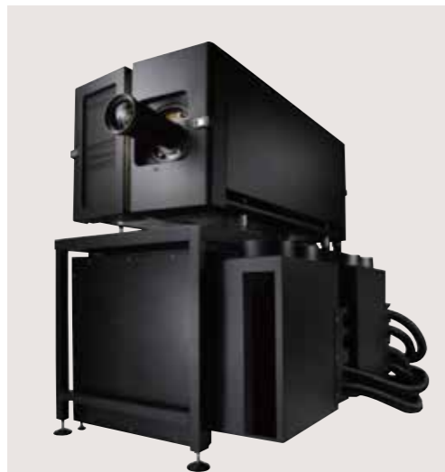
■ XDL-4K75 運用時参考イメージ チラーサイズ表(運用時はチラー2台使用)