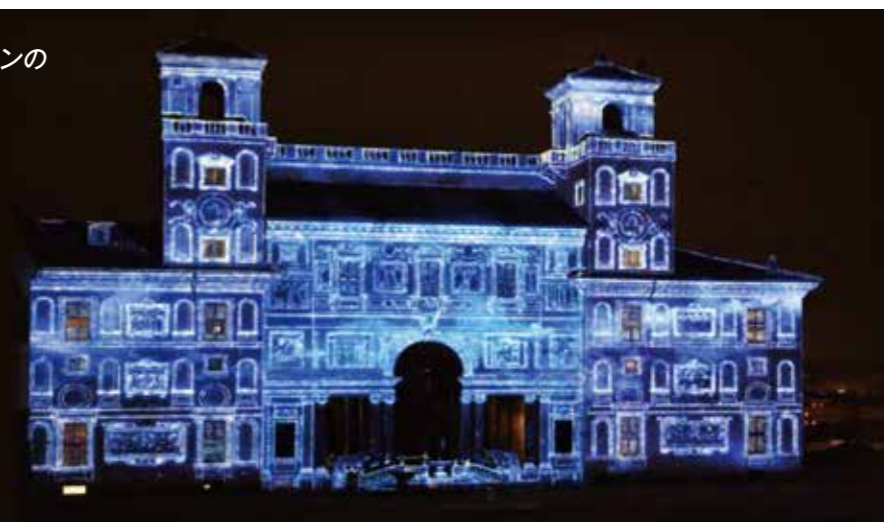
写真資料 BARCO XDL Series パンフレットより

75,000センタールーメンの 超高輝度を実現。 Rec.2020の色空間で 圧倒的輝度&高品位の 4Kの世界を再現する