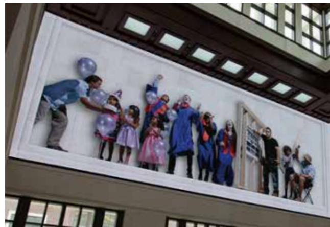
▲ バルコ株式会社Websiteより