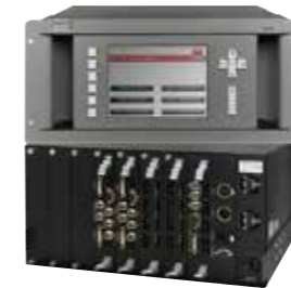
DX-700 Multi-window Image processor マルチウインドウ イメージプロセッサ