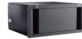
DX-100 Single-window video processor シングルウインドウ ビデオプロセッサ