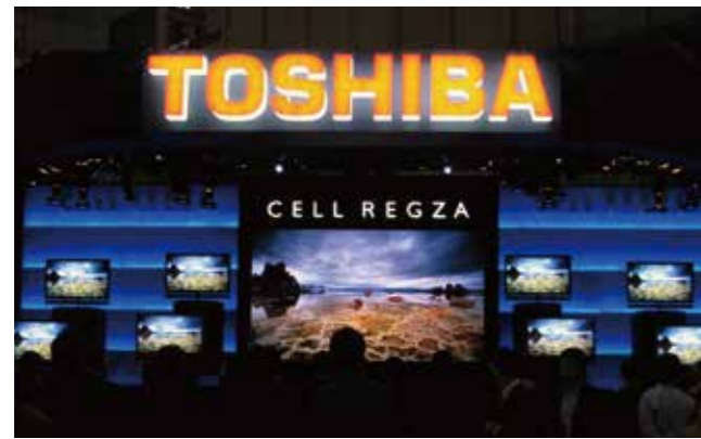
▲ CEATEC JAPAN 2009 TOSHIBAブース