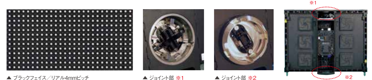
▲ ブラックフェイス/リアル4mmピッチ

最新技術を投入して限りなくフラットに仕上げられたスクリーン、 視認性を高めるブラックフェイス、新開発のジョイント部など 多くのノウハウをフィードバックした高精細4mmピッチLED