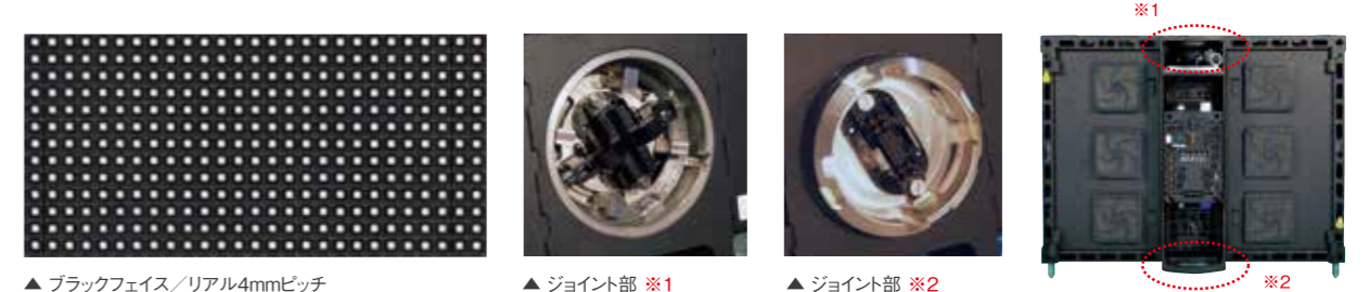
▲ ブラックフェイス/リアル4mmピッチ

最新技術を投入して限りなくフラットに仕上げられたスクリーン、 視認性を高めるブラックフェイス、新開発のジョイント部など 多くのノウハウをフィードバックした高精細4mmピッチLED