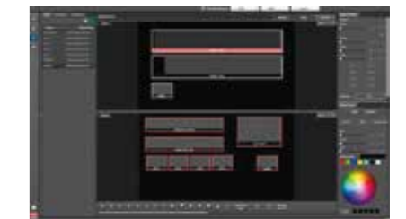
マルチビューワー・スクリーン