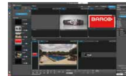
プログラミング・スクリーン