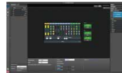
システム構成・スクリーン