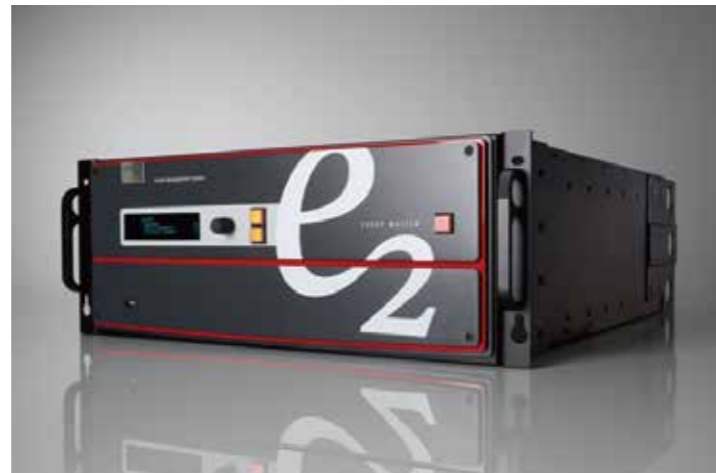
(単位:円 / 消費税別途)

E2プレゼンテーションシステムは、優れた画質、卓越した入出力密度、高い拡張性と耐久性を実現。ネイティブ4K入出力をサポートし、リフレッシュレート60Hzまでの4Kプロジェクター・ブレンドを管理できる世界初のスクリーン管理システム。1台で多彩なショー・コントロールを行うため8つのミックス可能なPGM出力と4つのスケールされたAUX出力が可能。