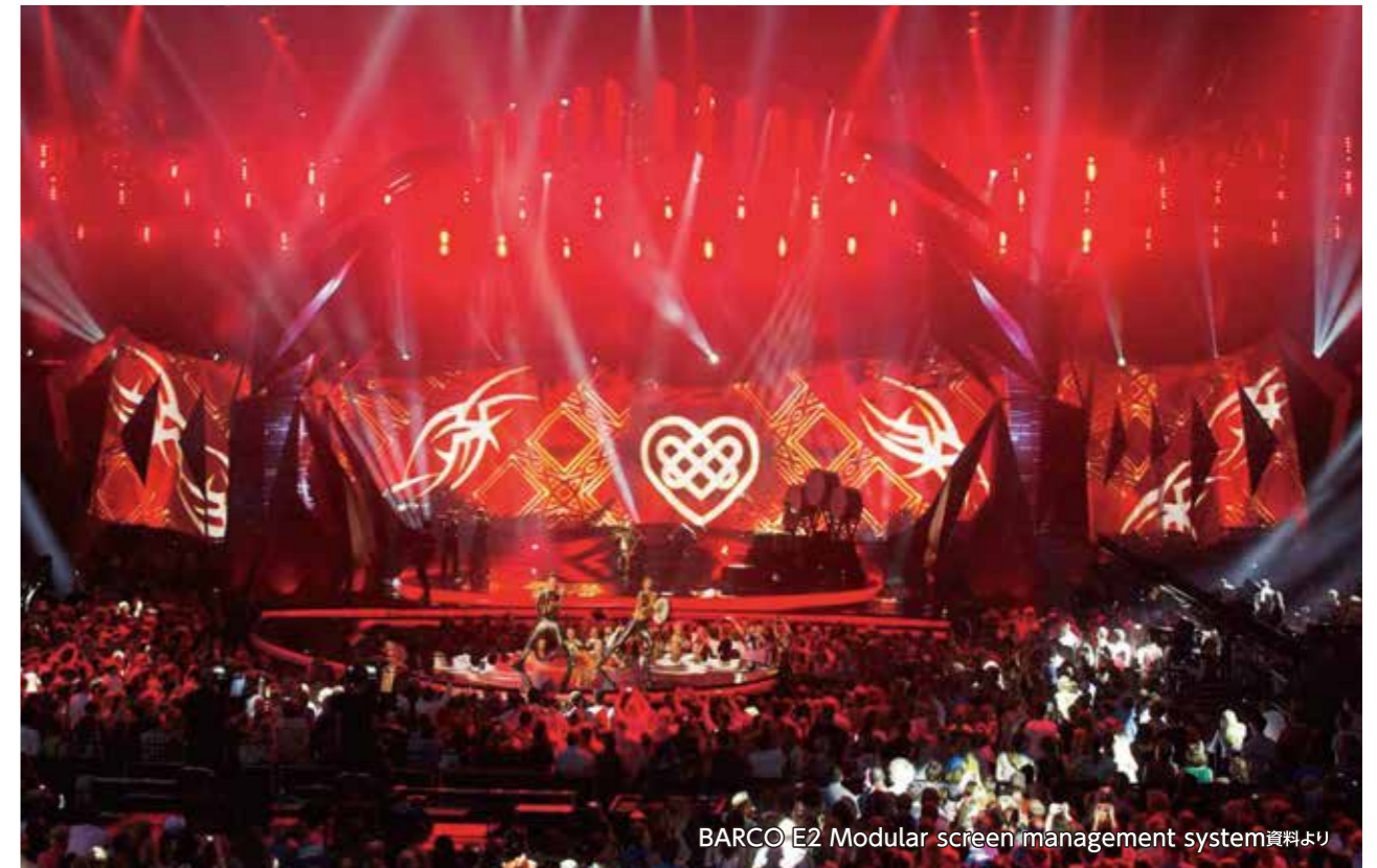
BARCO E2 Modular screen management system資料より

28の入力と14の出力(8xPGM、2xマルチビューワ、4xスケールされたAUX出力)を備えるE2システムは、8つの独立したPIPミキサーと専用マルチビューワを含む完全なショー・コントロールを実現。リンク可能なシャーシにより、信号を配信するための外部処理やルーティングを追加する必要なく、それらの8出力を超えて拡張が可能。入力とレイヤーも拡張可能、E2は、32x4Kプロジェクターまでのブレンドを管理することができます。