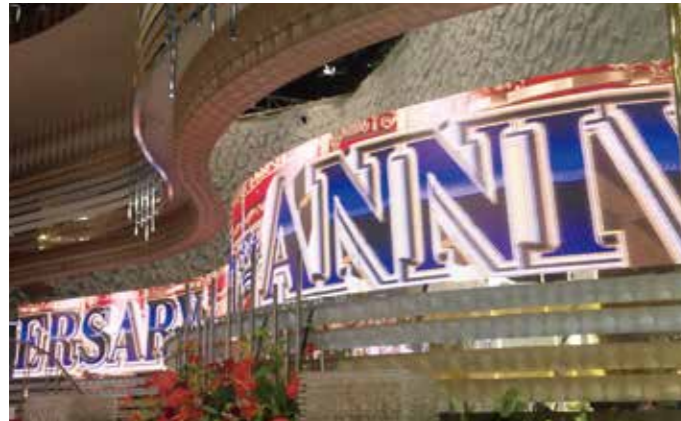
▲ フジテレビジョン