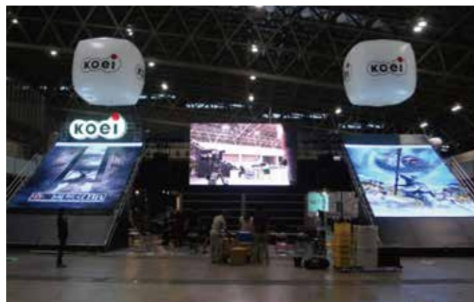
▲ 東京ゲームショウ KOEIブース