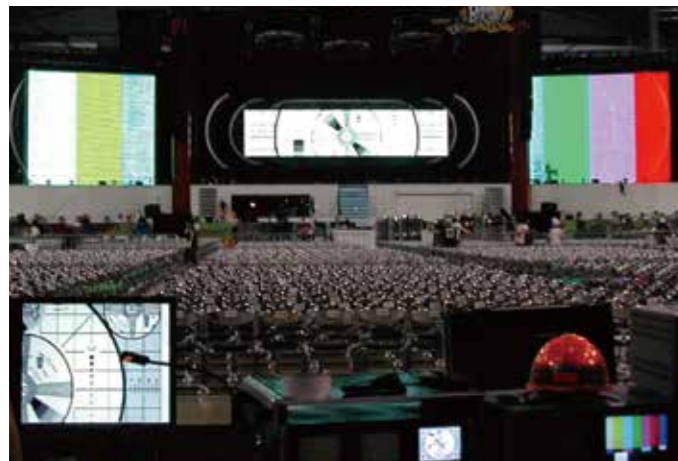
▲ スタジアムコンサート