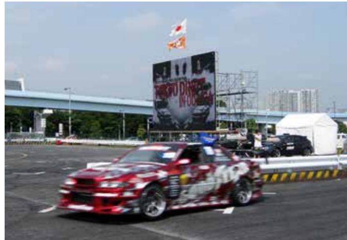
▲ D1 GRAND PRIX