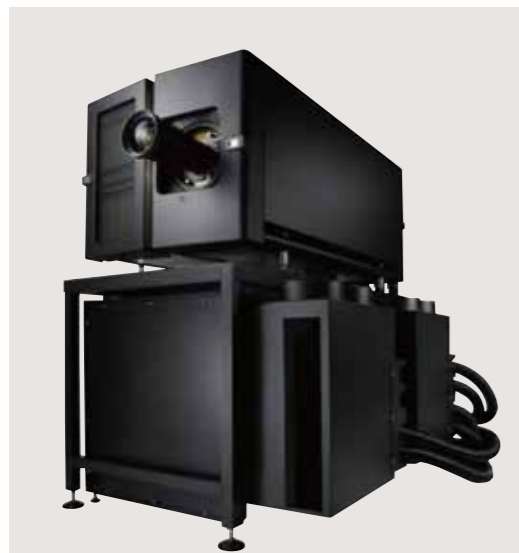
■ XDL-4K75 運用時参考イメージ チラーサイズ表(運用時はチラー2台使用)