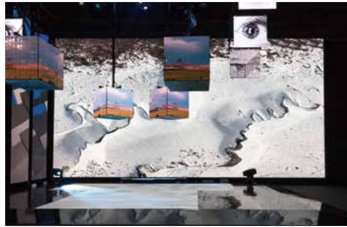
《 i-max Light 6w / i-max Light 6w-m2 の主な特長》